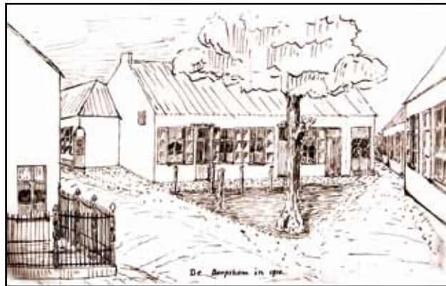
"De dorpskom in 1914" Schets van Meester Nelis.

Bij ons thuis hebben we zo wat rond gekeken en vastgesteld dat alles in orde was. We beslisten de wagen dan maar terug te halen. Plots, rond zeven uur, kwamen mensen vanuit de Herenthoutse steenweg het dorp ingelopen schreeuwend: "De Duitsers zijn daar!" Iedereen sloeg op de vlucht. In een mum van tijd was Nijlen leeg. De besten vluchtten met paard en kar, anderen met kruiwagens of handkar.