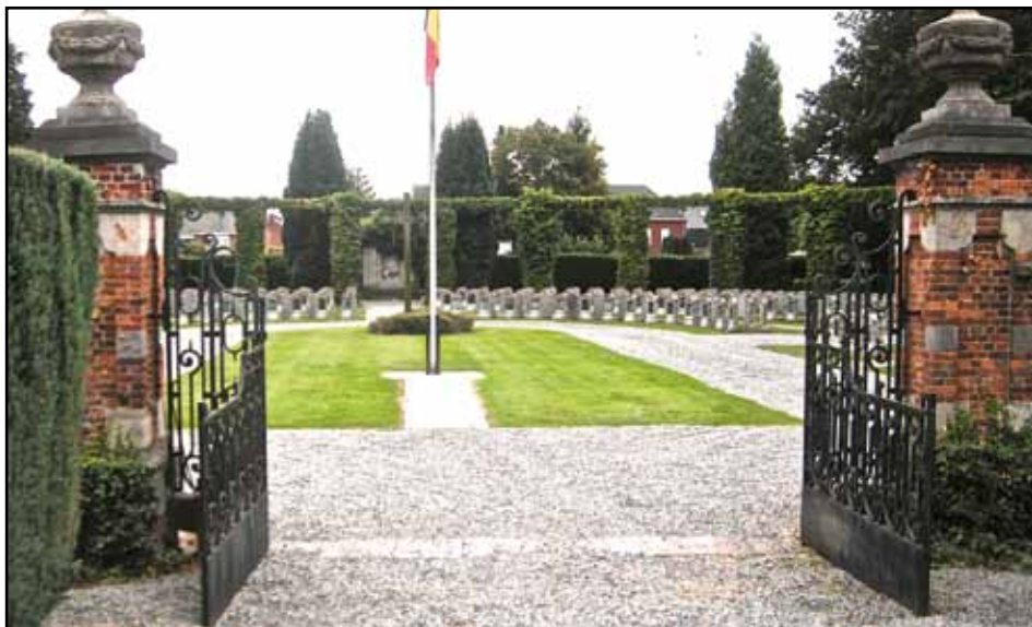
Op de militaire begraafplaats te Lier werden 143 jongens naamloos begraven. (zie Poemp 87/88).

Binnen de omheining van het gedenkteken van Tony Bergmann aan de vest te Lier lagen twee Duitsers, een officier en een soldaat. De pinhelmen lagen op hun graven. Officieren hadden een hogere pin op hun helm. Al deze ongelukkigen heeft men later bij elkaar gebracht op een