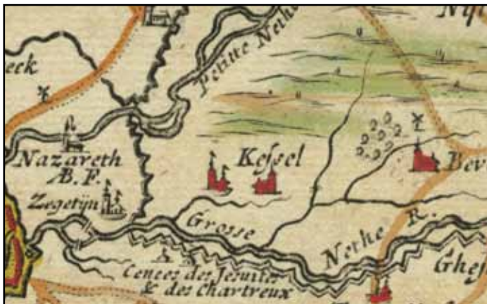
Detail Frickxkaart 1712. Tussen de "Petitte" en de "Grosse Nette" slingerde "de linie" zich door Terlaken.

Einde 17de eeuw waren onze gewesten in Spaanse handen. Toen koning Carlos II in 1700 kinderloos stierf, kwam zijn hele rijk in handen van Filips van Anjou, kleinzoon van de Franse koning Lodewijk de XIVde. Spanje en Frankrijk vormden nu één blok. Dit verstoorde de machtsverhoudingen in Europa. Engeland, Duitsland, Oostenrijk, de Republiek der Nederlanden en Portugal sloten een verbond tegen Frankrijk en trokken ten strijde. Waar gingen ze die slag uitvechten?