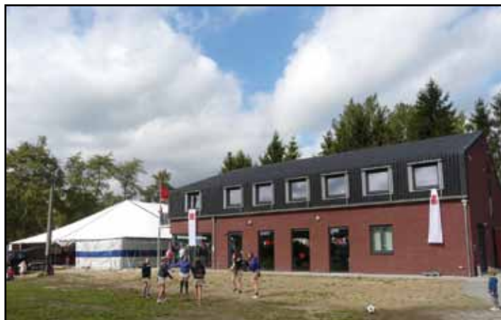
Een prachtig nieuw jeugdheem vraagt ook een nieuwe buiteninrichting!

Voor de historiek: lees onder meer Poemp 93, p. 10-12.