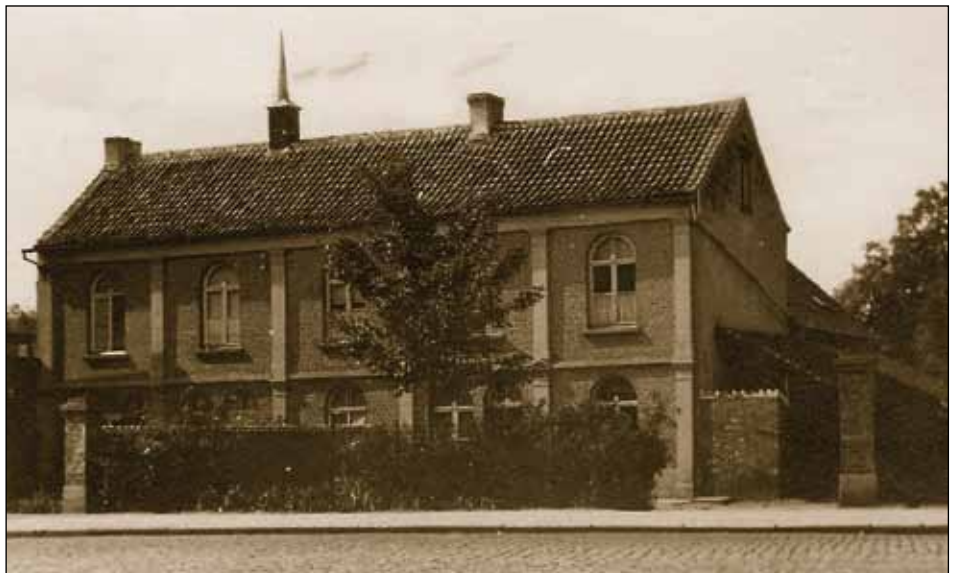
Nijlens eerste klooster of rusthuis.

Renilde Aelaerts verbleef er vaak en beschreef de indeling ervan als volgt. Bij het binnenkomen moest