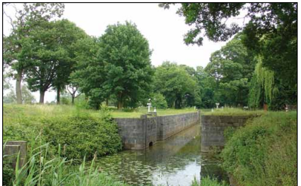
Sas 3 in Grobbendonk.