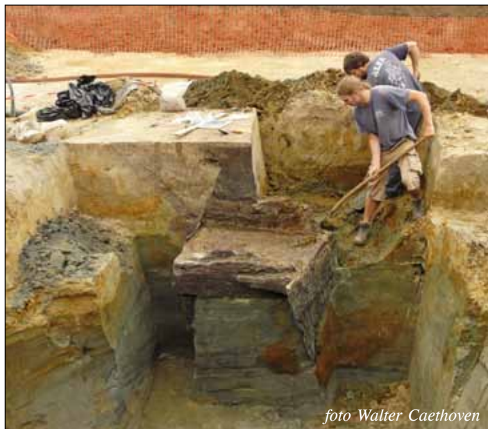
De tweede waterput van het Mussenpad in Nijlen wordt in april 2008 voorzichtig uitgegraven.

E nkele jaren geleden maakten we in De Poemp al melding van de resultaten van de archeologische opgraving aan het Mussenpad in Nijlen. Intussen is het wetenschappelijke onderzoek afgerond en gepubliceerd en heeft de provinciale dienst Erfgoed er ook een archeologiebrochure aan gewijd. De interessantste sporen van de opgraving zijn twee waterputten. Deze zijn integraal onderzocht en leren ons veel over de leefomgeving en de activiteiten van de toenmalige bewoners van het Mussenpad. We lichten hier kort deze aspecten van het onderzoek toe.