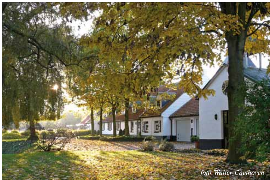
De Sluierhoeve anno 2015 : een oase van rust. Vooraan rechts de kapel.

In de beemden van de kleine Nete, tussen de Vogelzangstraat en de Krekelbeek juist voor de grens met Nijlen, werd ongeveer een halve eeuw geleden 't Hertenhof, 't Reservaat of de Sluierhoeve gebouwd. Ze ontleende deze laatste, poëtische naam aan de mistbanken die hier vaak als een sluier over het vochtige en moerassige landschap zweven.