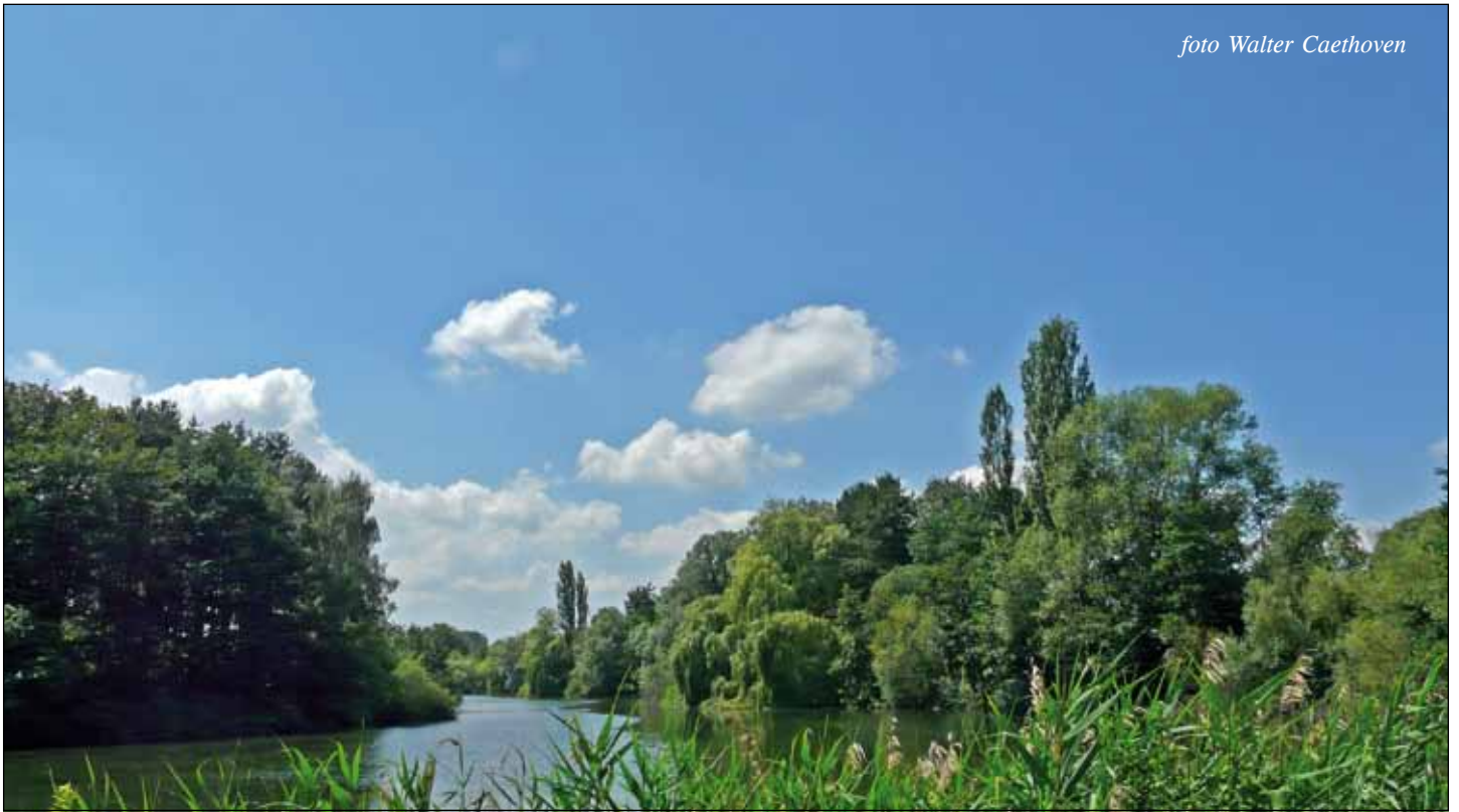
De Netevijvers, vlak bij taverne De Beemden: een uitverkoren, lieflijk rustpunt.

“De late zondagnamiddag hong vredig, kalm en stil over de duizend hooioppers, die riekend in de wijde beemden waren... Over de Nethe, aan de verre witte huizekens, was er traag harmonikagespeel, en een grote klok dommelde voor 't avondlof. Op de Netedijk, en in het hooggetijdewater zuiver weerkaatst, gingen twee kinderen, een in 't rood en een in 't wit, met hun armen vol paardenbloemen, en een zwert spitsken liep snuffelend achteraan. Het licht scheen uit den grond te komen”.