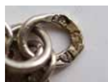
Sluiting ketting, detail.

boven het midden. De hoeken bovenaan zijn ingebogen.